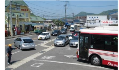
フェリー乗降車両混雑状況